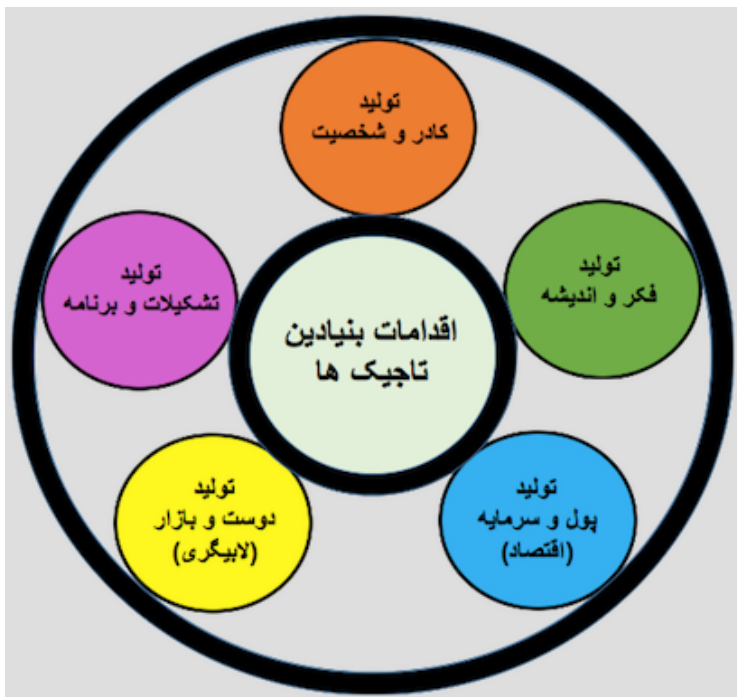
اقدامات بنیادین تاجیک ها

شوند و یا مایوس و دلسرد گردیده؛ مردم، شرایط و یا خارجی ها را ملامت دانسته و میدان مبارزه و مقاومت را رها می کنند.