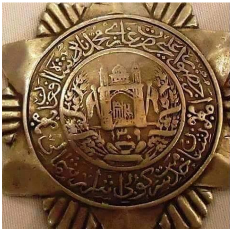
نشان خدمت سرکوبی اشرار شمالی

گردد، راست پنداشته می شود). ظاهرشاه در ۱۹۳۶ فرمان می دهد که «مامورین دولت مکلف اند تا مدت سه سال لسان افغانی را فرا گیرند». ضمناً، پشتون ها که خود را بنی اسراییل می گفتند، با پیروی از تیوری فاشیسم هتلر (نژاد برتر آریایی) خود را آریایی نامیدند تا به هتلر پیوند یابند. به این ترتیب، پروسه «دولت - ملت» سازی توسط شمشیر برای قوم «والا نژاد» افغان بنیاد گذاشته شده و حبیبی برای شاه جوان در ۱۹۳۸ چنین توصیه می کند: